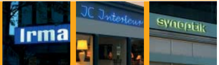
Eksempler på lysskilte og neonskilt med bøjede bogstaver.