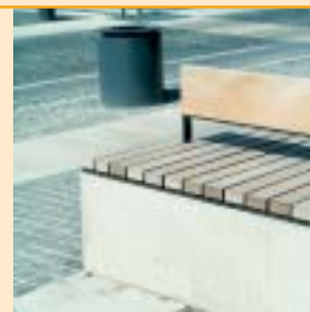
Et kig ned ad Taastrup Hovedgade.