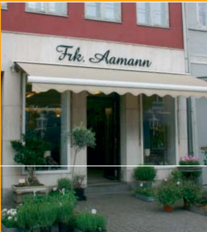
Markise af lærred og i en lys farve.