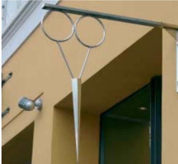
Et elegant og let udhængsskilt. Køge.