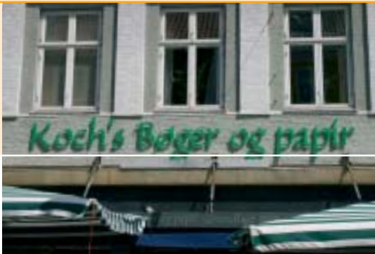
Eksempler på skiltning med opsatte enkelt bogstaver.